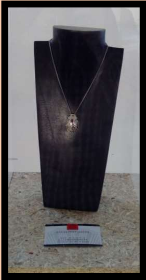
Lucas Pettazonni, Encéphale argent, grenat, oxyde