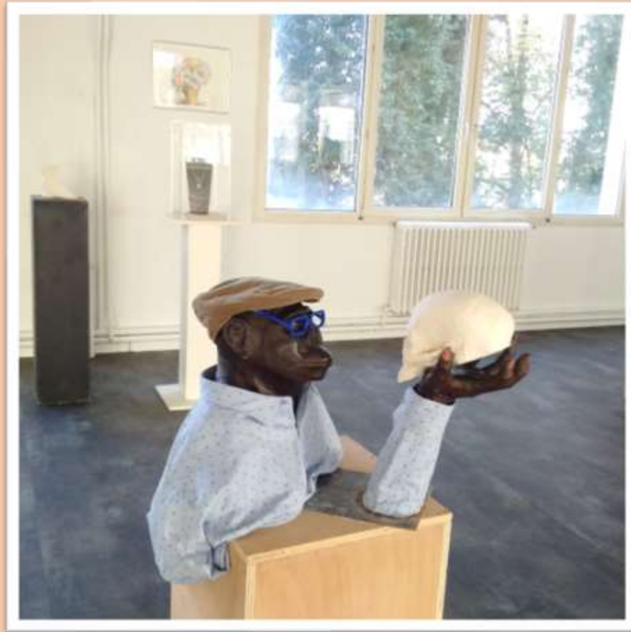
Jean-Louis Bouchon Scénario numéro 2 Plâtre, terre cuite